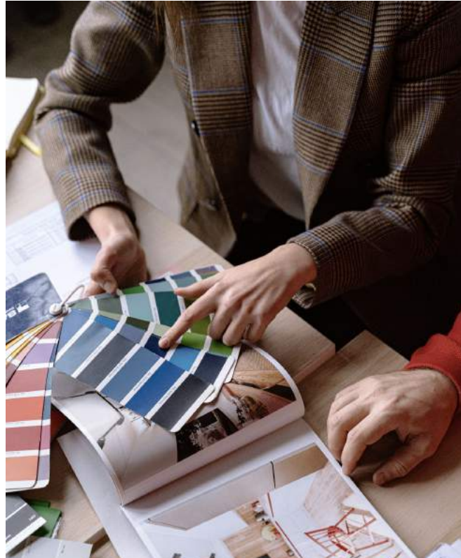
Serie 2 · Ops