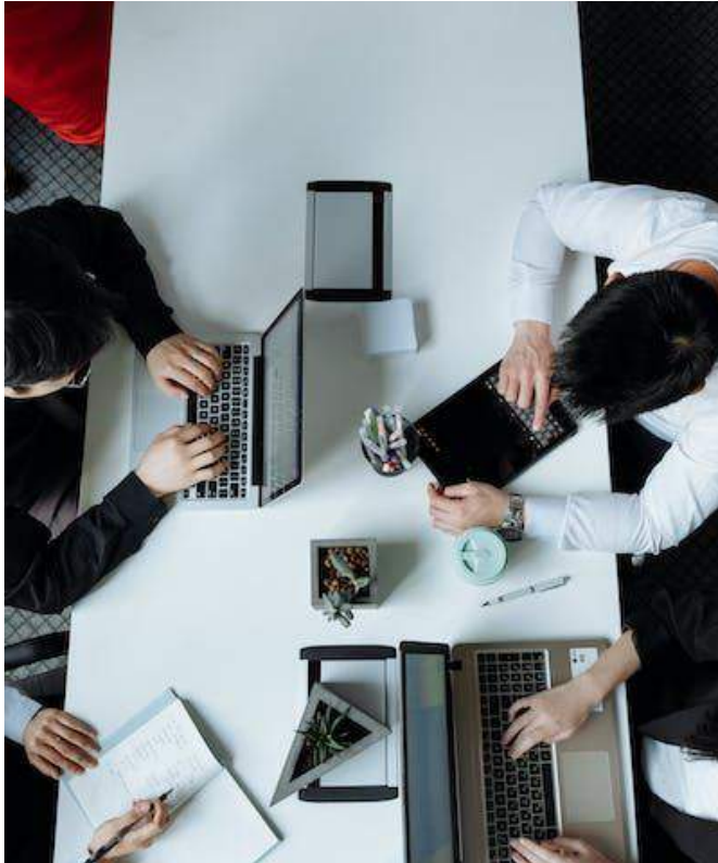
Serie 1 · Estrategia en diseño